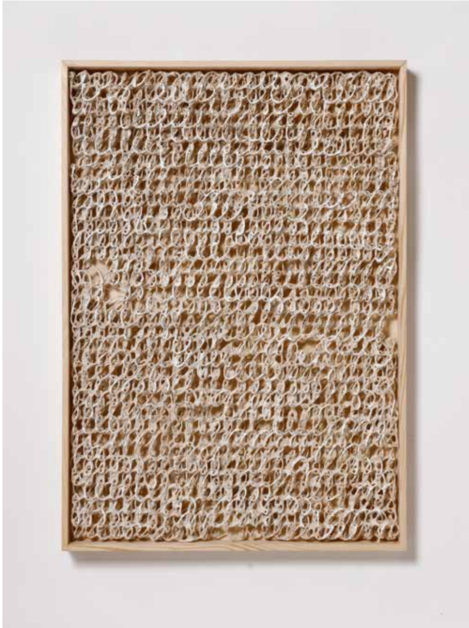
《Narrative act》2022年 / 藤、楮、漆喰、土性顔料 / h91.5 × w67.5 × d6cm Narrative act, 2022 rattan, paper mulberry (koso), shikkui (Japanese plaster), earth pigment h91.5 × w67.5 × d6cm