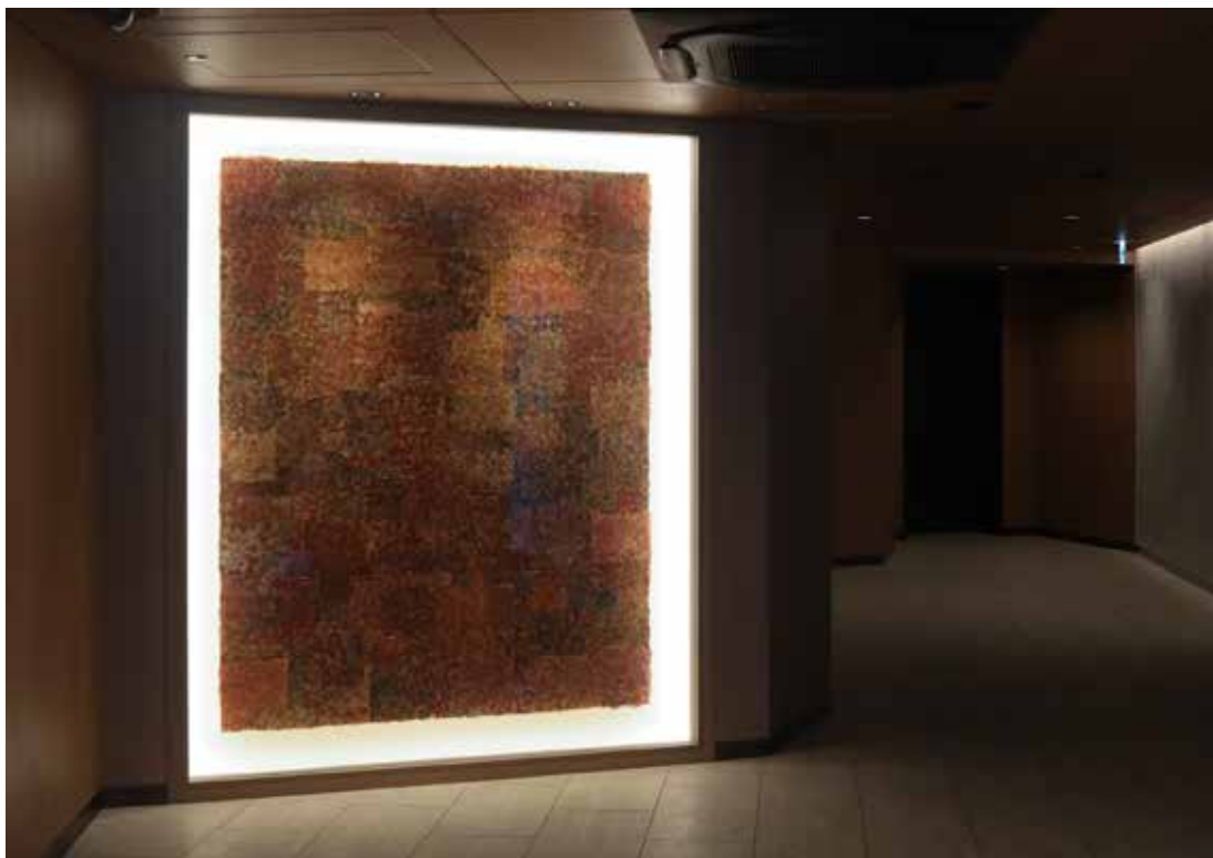
設置場所：パークホームズ西荻窪アベニュー（東京） 《Then and There, Here and Now》2025年 / 木材パルプ、染料、柿渋、亜麻仁油 / h178 × w140cm