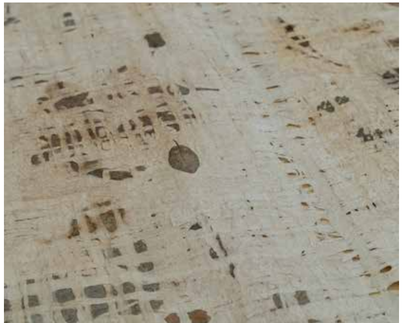
《アイサの庭のレシピ》2024年 / 植物、楮、和紙 / w150 × d236cm