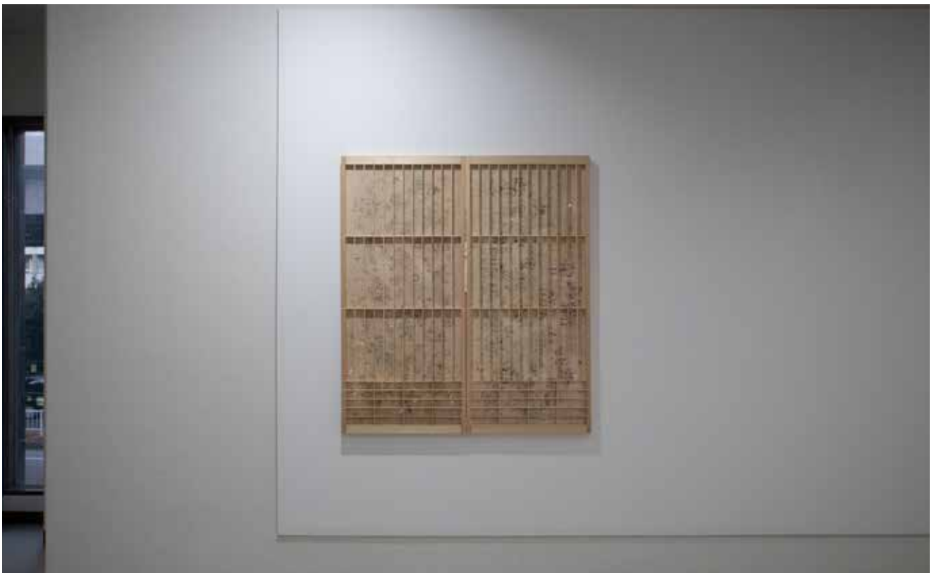
《もう一つの庭》2025年 / 楮、和紙に印刷、木 / h97 × w85 × d3cm

Another Garden, 2025/ paper mulberry (kozo), printed Japanese paper, wood/ h97 × w85 × d3cm