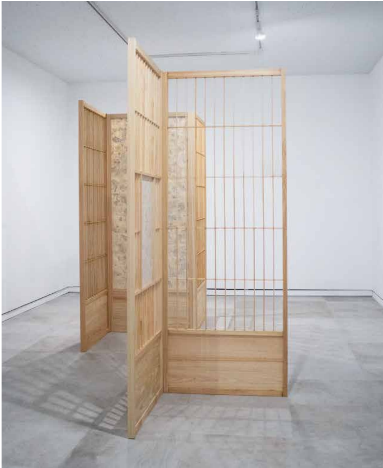
《庭》2025年 / 楮、和紙に印刷、木 / サイズ可変 (h175.4cm)

Garden, 2025/ paper mulberry (kozo), printed Japanese paper, wood/ dimensions variable