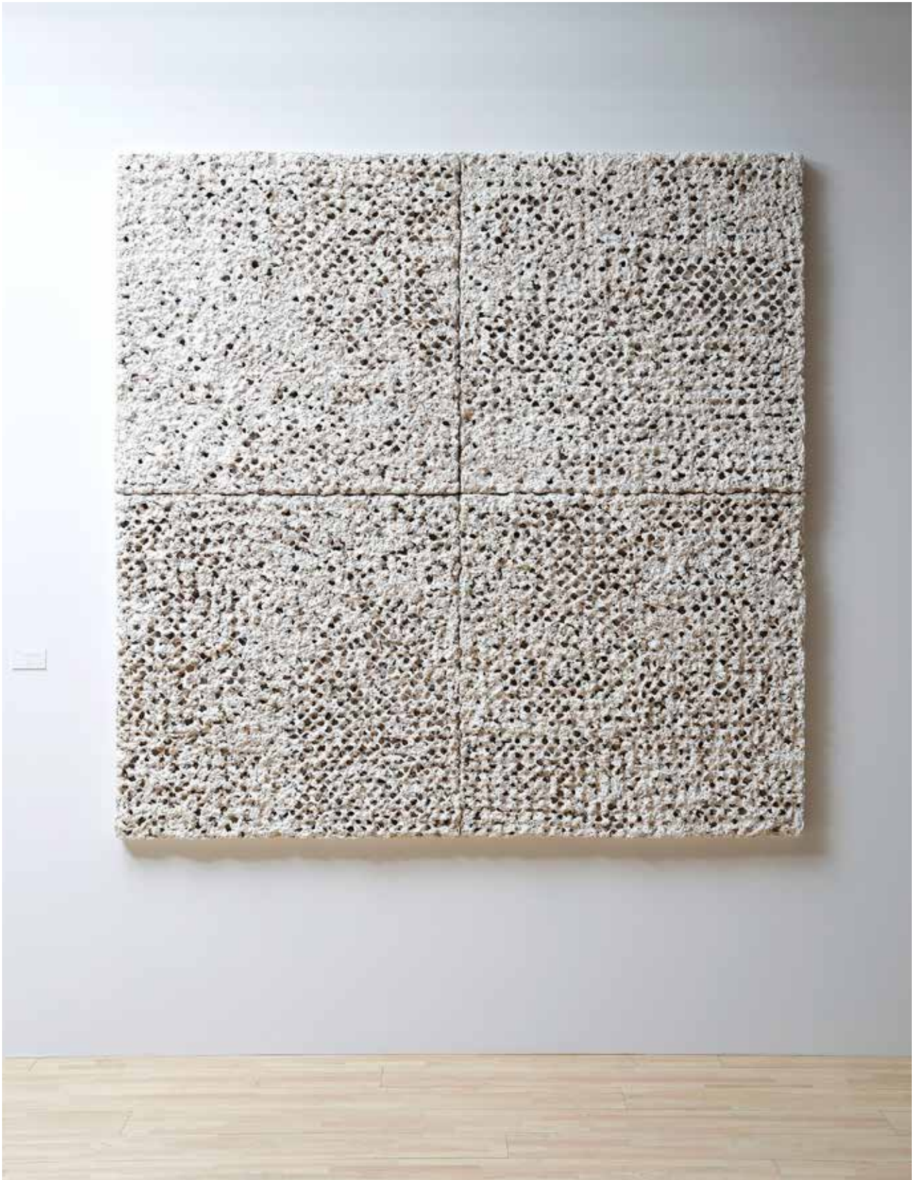
《Note》2020年 / 木材パルプ、楮、土性顔料、鉛筆、漆喰、金網 / h186 × w186 × 6cm

Note, 2020/ wood pulp, paper mulberry (koso), earth pigment, pencil, shikkui (Japanese plaster), wire mesh/ h186 × w186 × 6cm