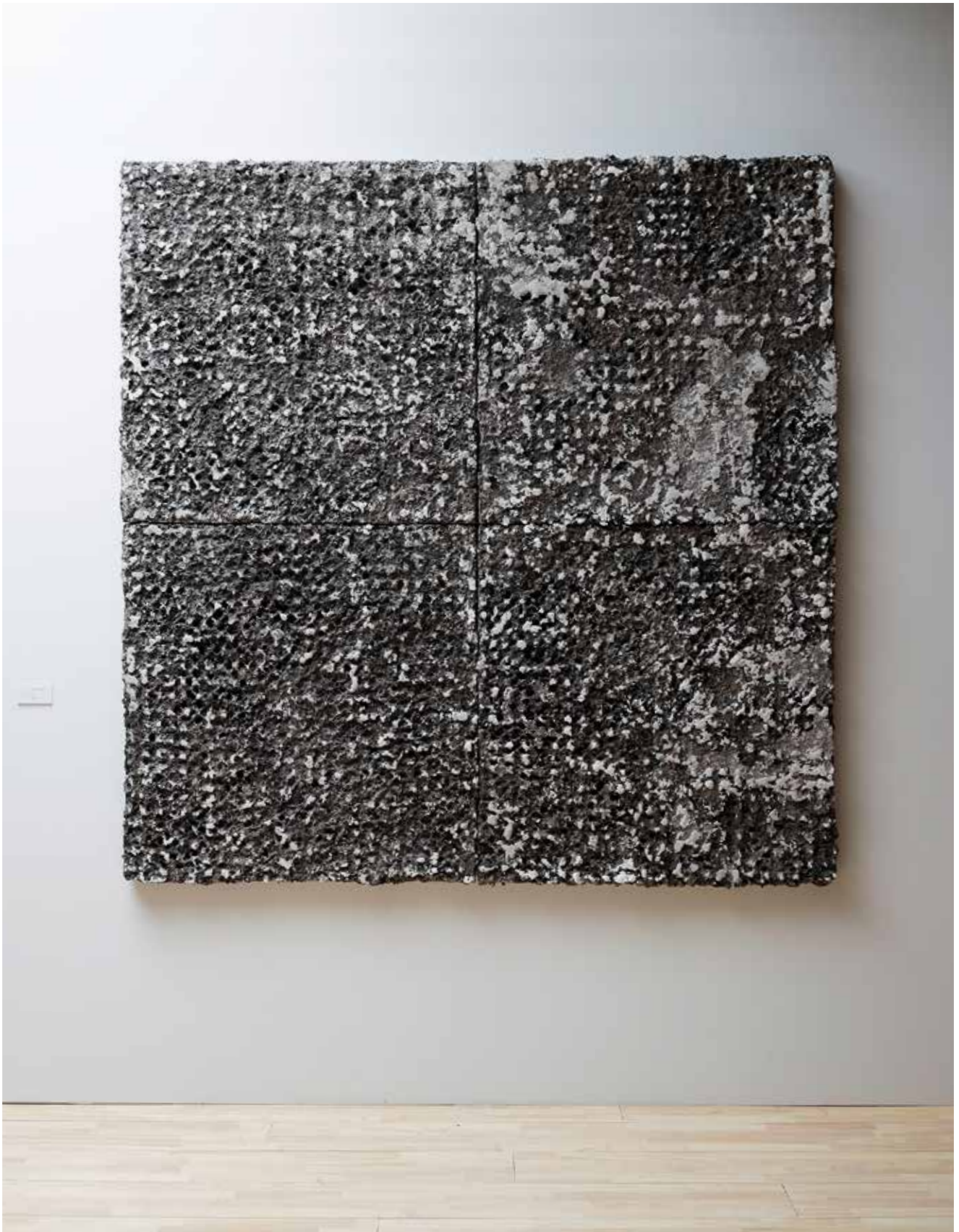
《Place》2020年 / 木材パルプ、楮、土性顔料、漆喰、金網 / h186 × w186 × 6cm

Place, 2020/ wood pulp, paper mulberry (koso), earth pigment, shikkui (Japanese plaster), wire mesh/ h186 × w186 × 6cm