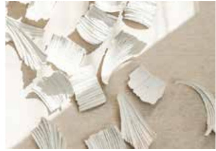
設置場所：ホテル虎ノ門ヒルズ（東京） 《白片の記》2023年 / 楮 / h680 × w280cm