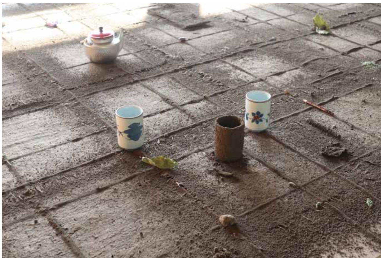
《談土図》2025年 / 楮、赤岩地区の桑の葉・植物・土、和紙、木材、他 / サイズ可変（テーブルサイズ h30 × w180 × d450cm）

The landscape of Akaiwa in Kuni has been shaped over a long period of time through the layered relations between nature and human life. The local community center has long served as a place where people gather, speak, and form relationships. In this work, mulberry leaves, local plants, and soil are integrated with plant fibers and arranged in a grid-like structure across a tabletop. By tracing the strata of culture and connection formed through the ongoing relationship between people and the land, the work reflects on how the structure of this place continues to be woven.