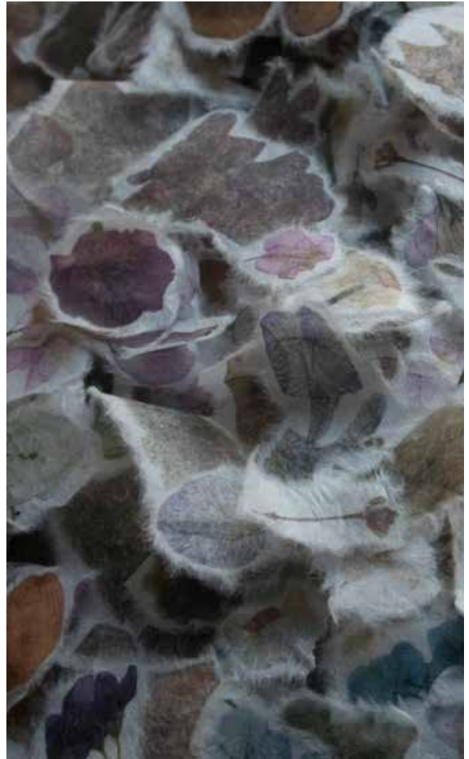
《一句 #1~5》2025年 / 和紙に印刷、木 / h36.8 × w6.8 × d3.4cm

The verse #1~5, 2025/ printed Japanese paper, wood/ h36.8 × w6.8 × d3.4cm