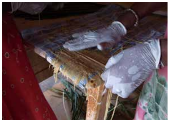
《彼女の手、彼女の生活》2024年 / セネガルの紙に鉛筆 / h65.2 × w50cm Her hands, her life, 2024/ pencil on Senegalese paper/ h65.2 × w50cm

セネガルの女性たちが作ったティファペーパーを素材にした作品です。ティファは水辺に生える植物で、その繊維を一筋ずつ並べて紙が作られます。女性たちが楽しそうにおしゃべりをしながら繊維を置いていくその様子を観察しながら、私は完成した紙の繊維の順序や重なり刻まれた彼女たちの手の軌跡をたどりました。日常の所作が物質のなかに静かに定着していく構造は、これまでの制作と重なります。