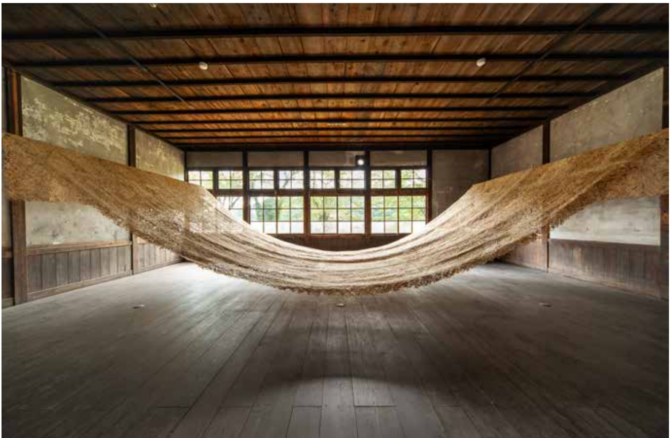
《叙景》2023年 / 中之条町の桑 / 350 × 1100cm

In Nakanojo, Gunma, where the Nakanojo Biennale is held, sericulture once flourished, and its memory remains inscribed in the mulberry trees still standing throughout the town. Collecting mulberry trees from the Kuni Akaiwa district, I stripped their bark, beat them with concrete blocks, and joined them together to create an installation spanning 350 × 1100cm. Through the series of actions—collecting, beating, and fixing the time held within the land—the structure through which the accumulation of time, environment, and human activity has continued to build a place quietly emerges.