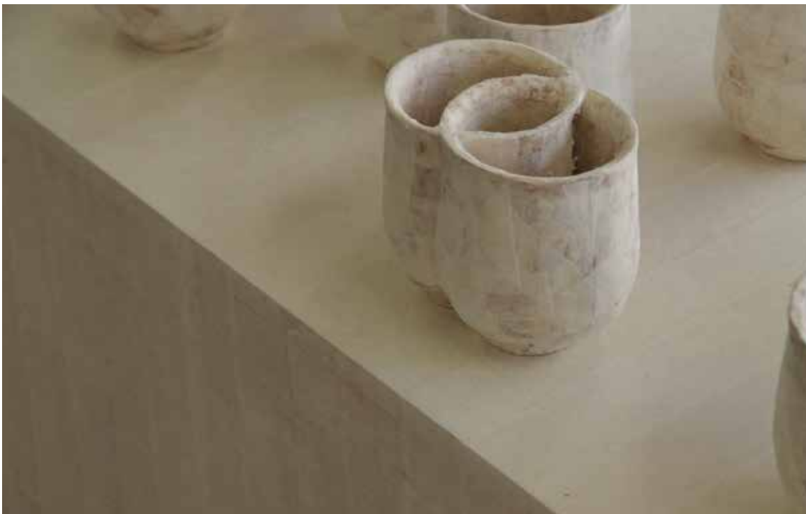
《Position (彼女と湯呑み)》2021年 / 和紙、柿渋、墨、湯呑み / h108.5 × w180 × d30cm Position (she with teacup) , 2021 / Japanese paper, persimmon tannin, ink, Japanese teacup / h108.5 × w180 × d30cm