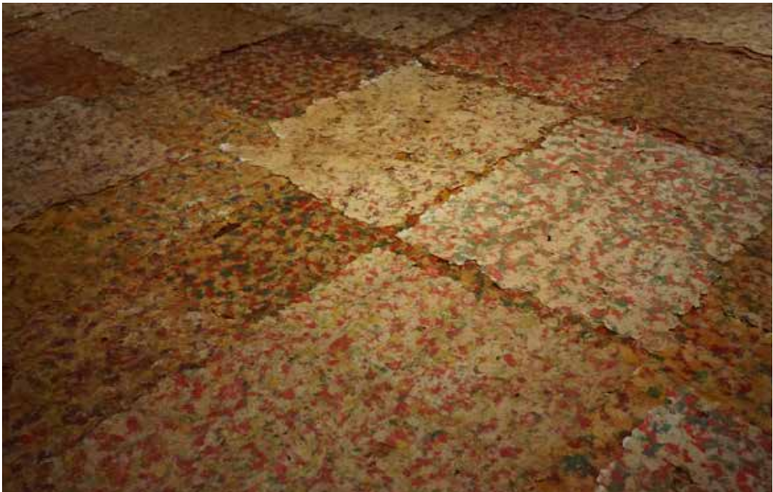
《Self》2019-2022年 / 木材パルプ、柿渋、亜麻仁油 / サイズ可変、1050 × 400cm (各 86 × 66cm) Self, 2019-2022/ wood pulp, dye, persimmon tannin, linseed oil/ variable size, 1050 × 400cm(86 × 66cm each)

スポットから落とされた一滴の紙料（木材パルプ）を、時間や出来事の粒子として捉えたシリーズです。繊維が重なり絡まりながら定着していく過程を反復することで、各 86 × 66cm のピースが生まれ、それらを床に展開するインスタレーションとして構成しています。一滴ずつ落とされた繊維は、偶然の絡まりや偏りを含んだまま定着し、重なり合いながら固有の集合体をつくります。複数の繊維が混ざり合いひとつの物質へと変容していくこの過程は、他者や環境との関係が個の内部に取り込まれ、更新され続けていく構造を示しています。さらに柿渋やアマニ油の効果によって時間を含むと変色していき、展示中も展示後も新たな時間の重なりを持ち続けます。多様な今、時間の交錯、重層化とともに形成される個人史を通して、自己の有り様を問いかける作品です。