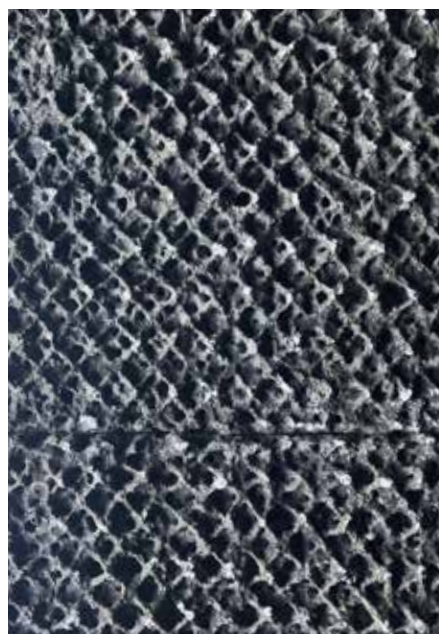
2025 木材パルプ、雲母、漆喰、染料、土性顔料、金網 h120cm × w180 × d4cm