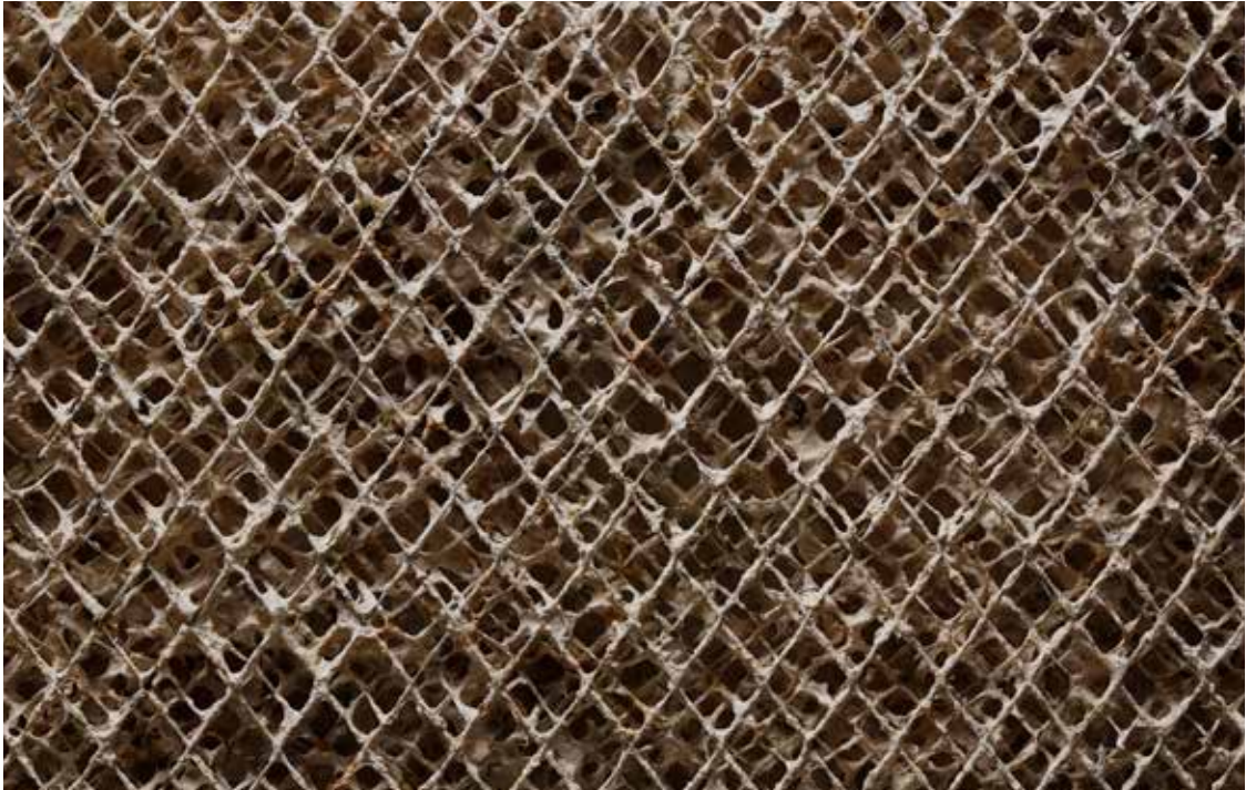
《Traces》2022年 / 木材パルプ、土性顔料、金網 / h101 × w101 × d8cm Traces, 2022/ wood pulp, earth pigment, wire mesh/ h101 × w101 × d8cm

何層にも交錯する金属の網目に紙漉きを行った作品です。紙の原料である植物繊維とペイントを、絡めては解くを繰り返すことで、通常の紙としての密度を持たない物質へと変容しています。ペイントの欠片や繊維の気配のみが残るその表面は、経過する時間や出来事が常に交錯し、増幅と喪失を繰り返しながら、痕跡だけが現在に姿を現す状態を示しています。記録媒体である紙の構造を解体し再構築することを通じて、記録と記憶のあり方を問いかけます。