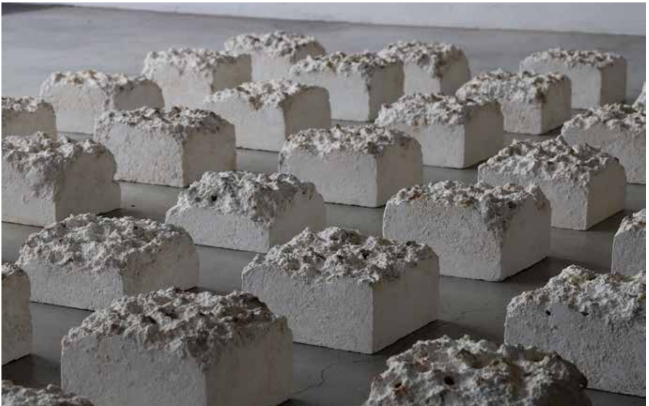
《Note》2021年 / 木材パルプ、楮、土性顔料、鉛筆、漆喰、金網 / 各 h16~ × w15 × d15cm Note, 2021/ wood pulp, paper mulberry (koso), earth pigment, pencil, shikkui (Japanese plaster), wire mesh h16~ × w15 × d15cm each