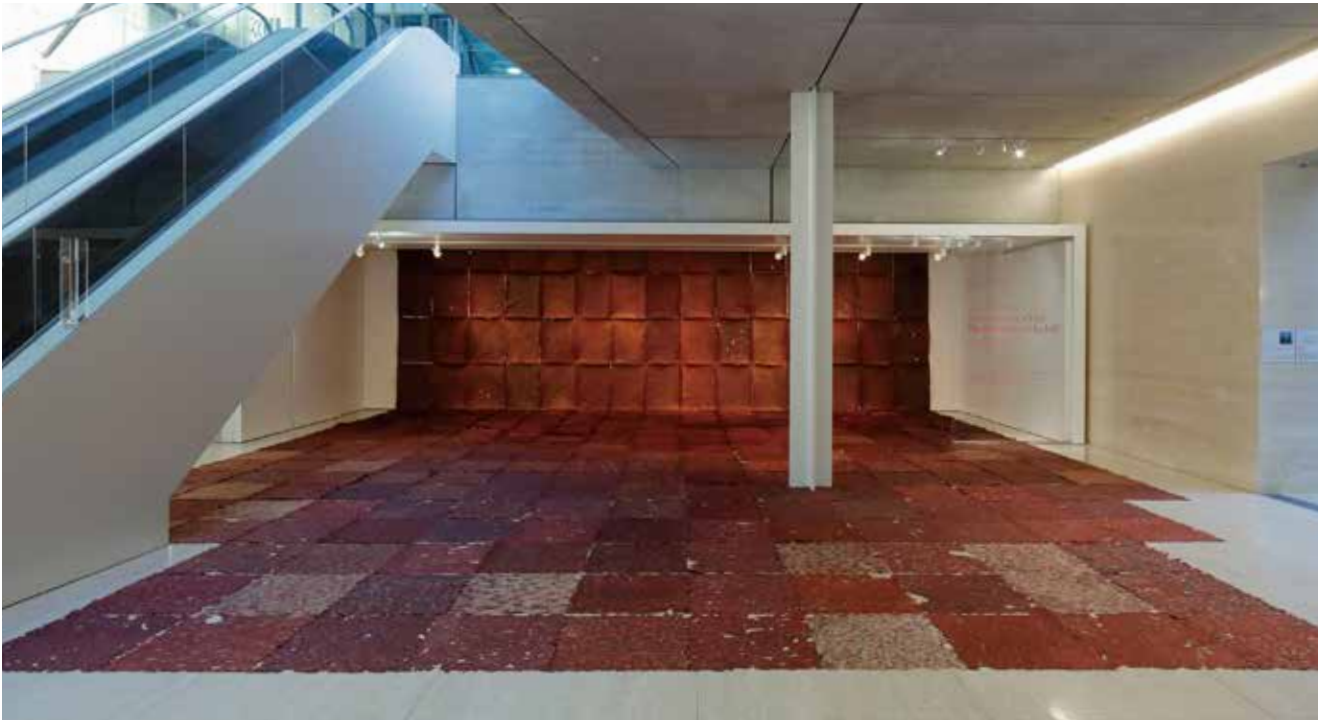
《The Histories of the Self》2019年 木材パルプ、染料、柿渋、亜麻仁油 サイズ可変、各 86 × 66cm The Histories of the Self, 2019 wood pulp, dye, persimmon tannin, linseed oil variable size, 86 × 66cm each