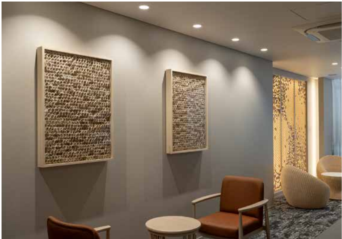
設置場所：グランクレール HARUMI FLAG（東京） 《Narrative act》2022年 / 籐、楮、漆喰、土性顔料 / 各 h91.5 × w67.5 × d6cm