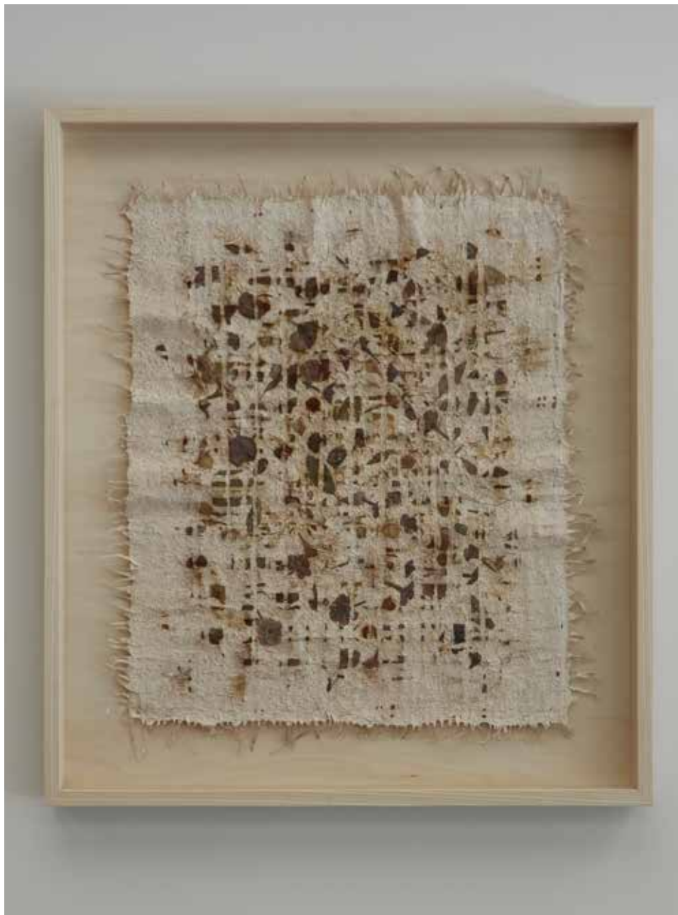
《アイサの庭のレシピ》2024年 / 植物、楮、和紙 / h86.2 × 74.8cm Recipe for Aïssa's garden, 2024/plants, paper mulberry (koso), Japanese paper h86.2 × 74.8cm