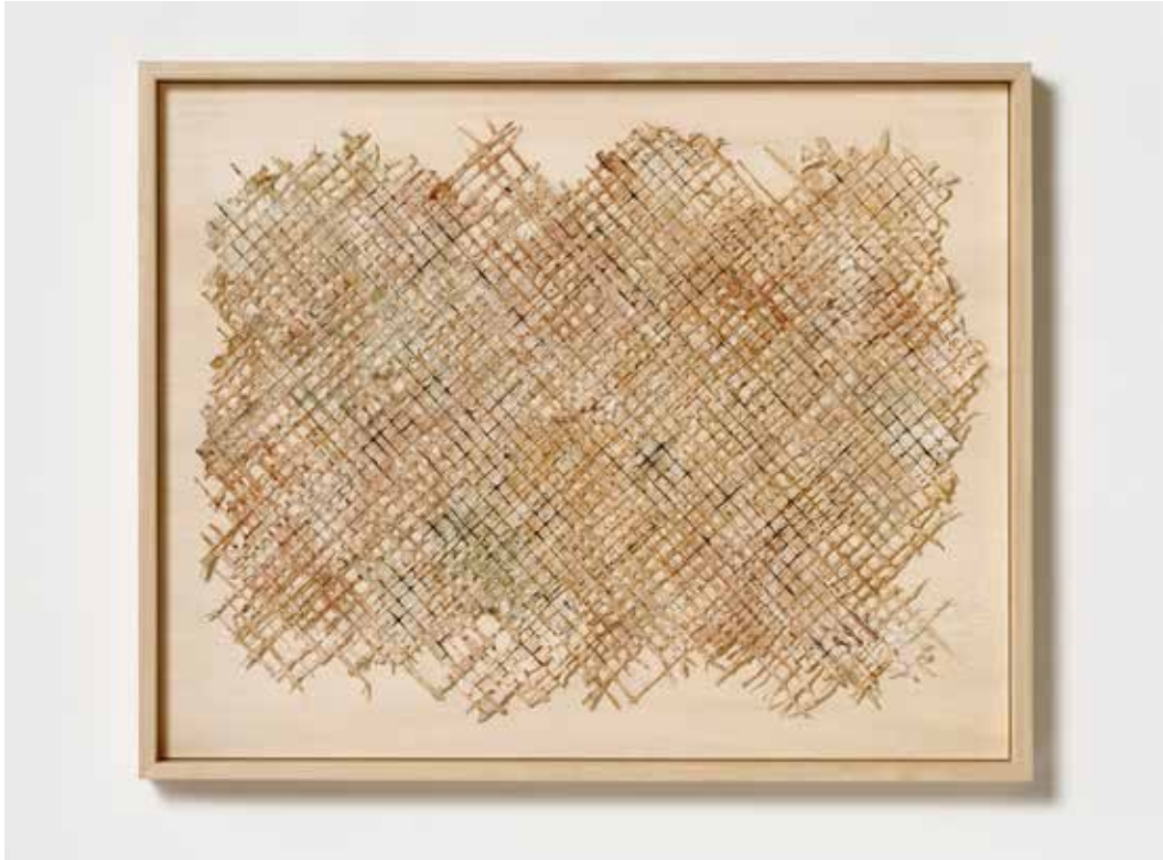
《Trails of intersecting》2022年 / 楮、土性顔料 / h55 × w43cm Trails of intersecting, 2022/ paper mulberry (koko), earth pigment/ h55 × w43cm

記録するための地としてあまりにも普通に使われている紙もまた、実は構造物であり、形成される過程で時間、環境、出来事といったさまざまな事物が交錯した痕跡でもあります。木の皮を並べる際に使ったガイド線を版にし、できあがった樹皮紙の上にそのガイド線を再び現しました。紙ができる過程で生じるずれや抜けを辿り直すことで、普段は見えない形成の構造が浮かび上がってきます。