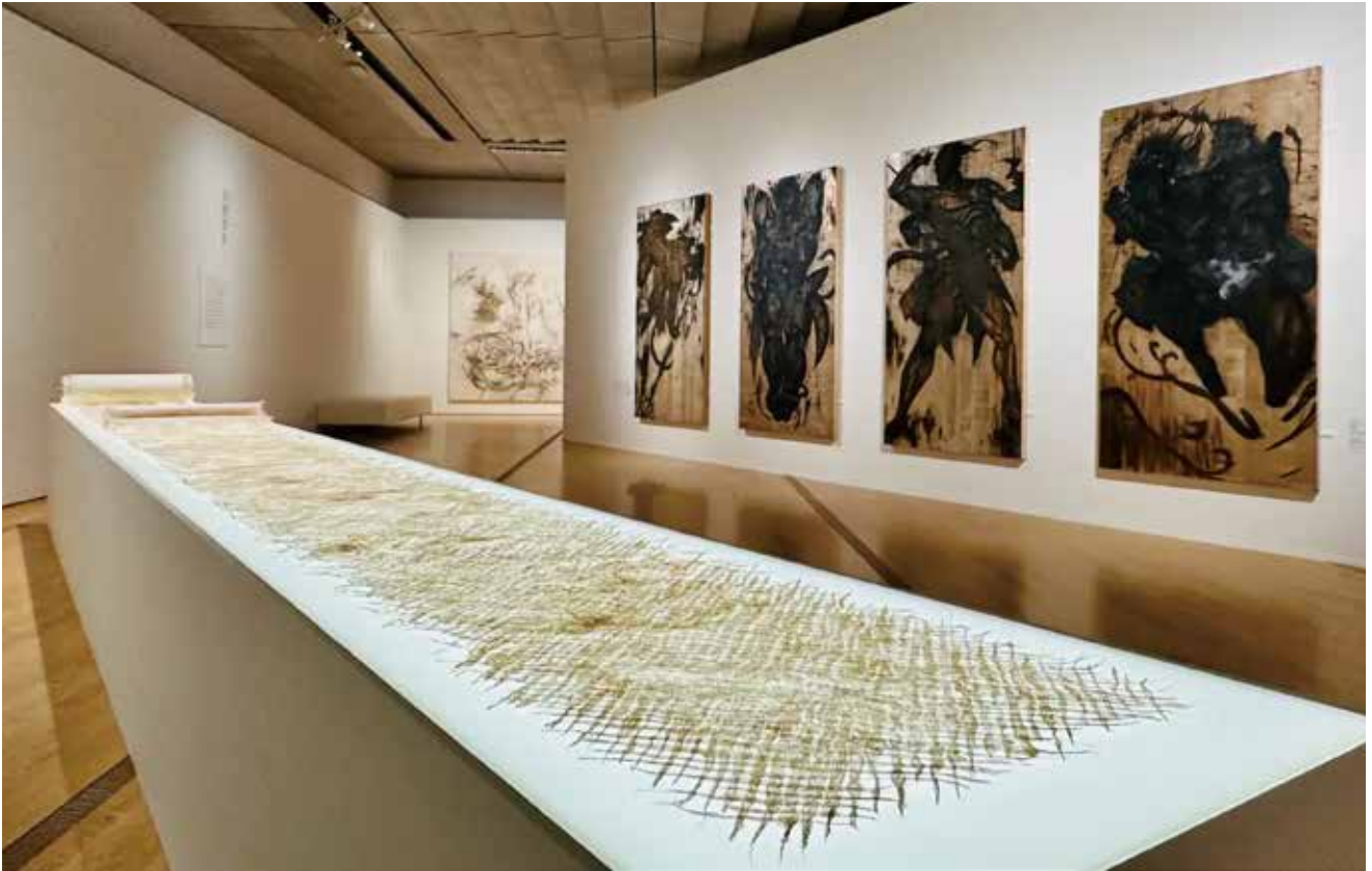
《生々流々》2023年 / 楮、和紙に印刷（祖母のメモ書き） / 56 × 4140cm Live Each Day, 2023/ paper mulberry (kozo), printed Japanese paper/ 56 × 4140cm

横山大観の《生々流転》に倣い、和紙の原料である楮を用いて、《生々流転》とほぼ同じ40メートルの長さの樹皮紙を制作しました。紙の繊維のなかには、認知症を患った祖母が日々をつなぎ止めるために書き残した、無数のメモが複雑に交錯しながら織り込まれています。メモは見え隠れしながら紙のなかを漂い、流れていきます。大観が《生々流転》で水の流れを描いたように、本作は日々を掴もうとしながら生きるひとりの人間の姿を通して、現在の「生」のあり方を見つめ直す作品です。本作は「シン・ジャパニーズ・ペインティング」（ポーラ美術館、神奈川、2023年）のために制作し、作品のそばにテキストも展示しました。 Inspired by Yokoyama Taikan's Seisei-Ruten (The Wheel of Life), I produced a continuous 40-meter-long sheet of bark paper using kozo, the raw material of washi. Woven into the paper's fibers are countless notes left by my grandmother, who suffered from dementia, as she tried to tether herself to each passing day. Much like Taikan's work tracing the flow of water, this series of drifting, fragmentary words connects the accumulation of one person's earnest "present" to the vast flow of life.